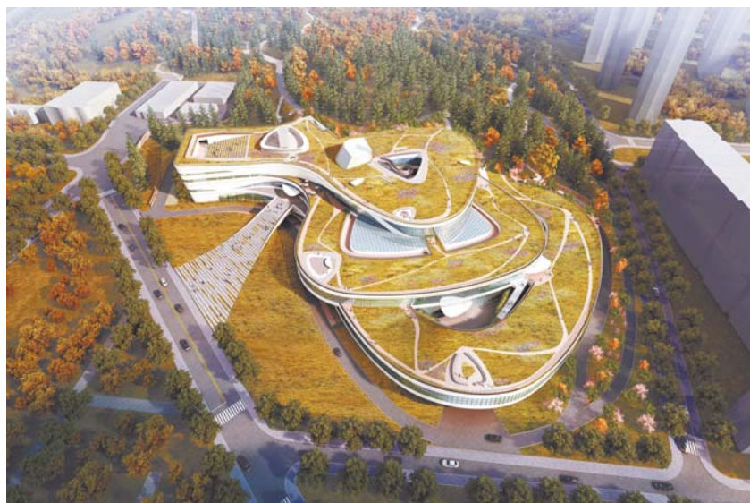
中建八局四公司承建的中国石油大学(华东)图书馆效果图。

企业作为青岛市建筑行业的排头兵，以雄厚实力名列青岛市百强企业前30，EPC、PPP和融投资带动工程总承包业务协同并进，市政、高速、管廊、轨道