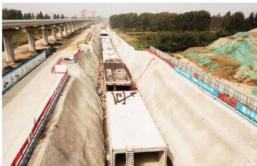
新区地下综合管廊项目贡北路段航拍图。

据介绍，地下综合管廊的设计使用寿命要达到100年，不同于地上建筑的是，地下施工需要重点考虑抗震、防水等多种控制因素，工程实体质量必须能够经受多种考验，入廊各类管线运行必须确保绝对安全。在该项目施工过程中，中国建筑大力推广“四新”应用，采用了新型模板支撑体系，确保混凝土浇筑质量，并成功申请国家专利和工法。引入无人机设备协助施工管理，通过航拍，以空中视角直观记录工程环境、施工进度、施工难点等内容。推广应用GIS技术，提高数据采集处理效率；引入BIM施工管理平台，在可视化交底、制定管线保护方案、新模板工艺方案设计、成本管控等方面形成了相应成果。