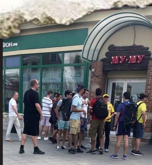
在官方售票处，有人与球迷讨价还价。

“一般收票的话我们肯定要压价，然后后卖的时候抬抬价，比如你问的这场阿根廷和尼日利亚小组赛，我也和你讲实话，我是400美元收的，卖给你700美元我也得赚一点啊，我在这里机票、住宿、吃饭也都是要花钱的对不对，我也付出成本了啊，我还承担风险，收来的票卖不出去怎么办？警察来查我罚款怎么办？我干的是体力加脑力的活，这么辛苦赚一点也是应该