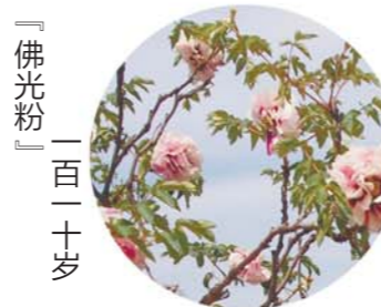
「佛光粉」 一百二十岁

坐标：大田 老家：菏泽周花园村 花紫红色，皇冠形，花径17cm×13cm，花朵中大，侧垂，外花瓣平布舒展，内瓣致密高起，瓣基棕红斑中大，色斑椭圆形。