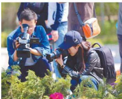
摄影师们拍摄牡丹之美。