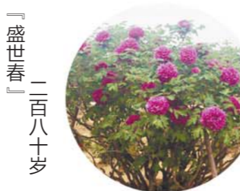
「盛世春」 二百八十岁

坐标：大田 老家：菏泽卢堍堆村 花浅粉白色，皇冠形或者绣球形，花径17cm×9cm，花头直立或侧开，花瓣基部黑色斑呈扇形。