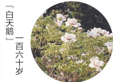
「白天鹅」 一百六十岁

坐标：牡丹亭 老家：菏泽李集村 初开为浅粉色，荷花形，盛开后显白色。花径17cm×7cm，花头直立，外花瓣4~5轮，内轮花瓣顶端多裂，瓣基棕红色或紫红，色斑椭圆形或卵圆形。