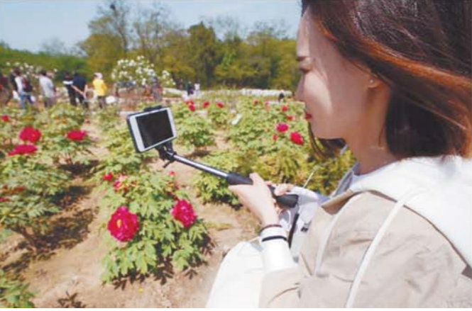
游客用手机定格牡丹之美。