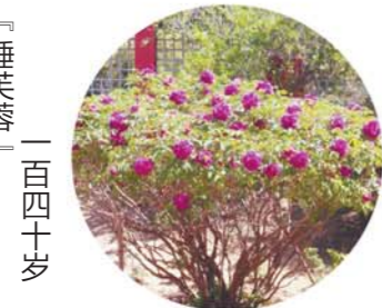
「睡芙蓉」 一百四十岁

坐标：牡丹亭 老家：菏泽李集村 初开为浅粉色，荷花形，盛开后显白色。花径17cm×7cm，花头直立，外花瓣4~5轮，内轮花瓣顶端多裂，瓣基棕红色或紫红，色斑椭圆形或卵圆形。