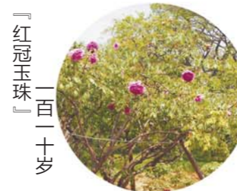
「红冠玉珠」 一百二十岁

坐标：大田 老家：菏泽孔花园村 花紫红色，皇冠形，花径18cm×9cm，花朵中大，外瓣平直舒展，内瓣卷曲，瓣端有雌蕊残留，色斑椭圆形。