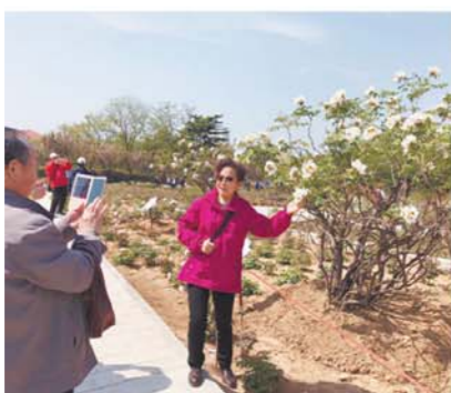
居民与百岁牡丹合影。