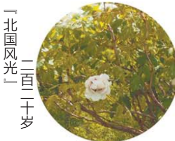
「北国风光」 二百二十岁

坐标：大田 老家：菏泽李集村 花乳色，皇冠形，花径17cm×11cm，花朵偏中大，直立或侧垂，外花瓣平布舒展，内花瓣层层叠叠，瓣基棕红斑，色斑呈卵形。