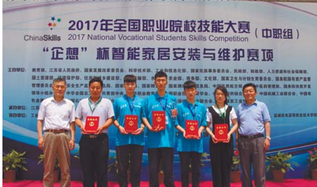
城管学校学子全国技能大赛荣获金奖。