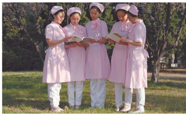
青岛卫生学校——白衣天使的摇篮。