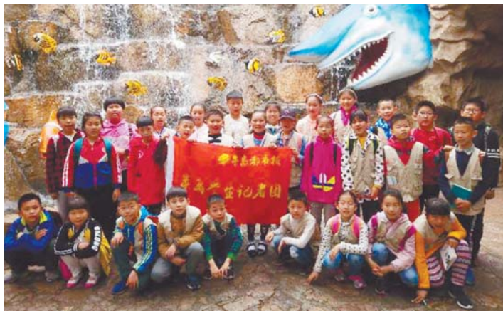
半岛学生记者们来到青岛海底世界,参观“海底小纵队”主题生物展。