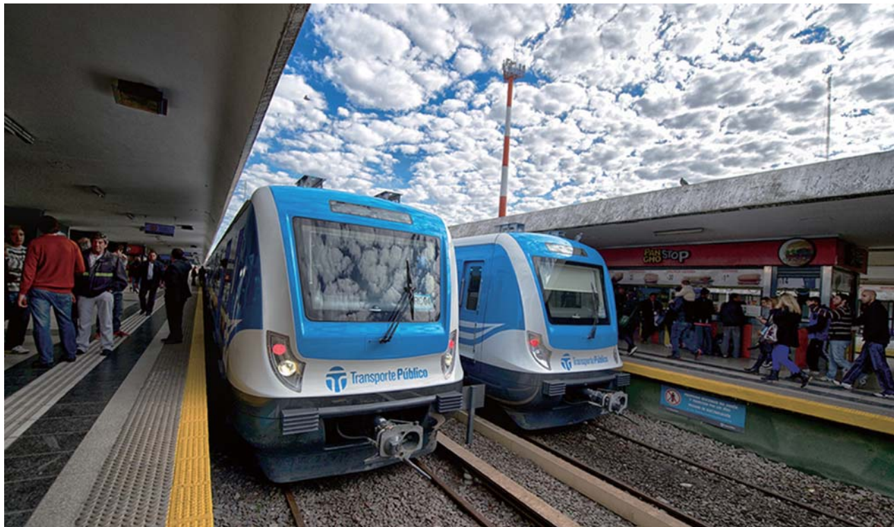
中车四方出口阿根廷的城际动车组。

记者获悉，随着“一带一路”倡议的深入实施，我国高铁装备制造企业已经成为率先走出去、与“一带一路”沿线国家广泛开展合作的排头兵，而中车四方股份公司则是其中的佼佼者。“一带一路”促成“高铁出海”，截至去年，中车四方在海外获得的出口订单累计已超过5000辆，产品出口20多个国家和地区，与阿根廷、美国、印度尼西亚等国家的合作项目已经陆续实施。