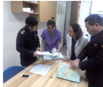
执法人员在检查药房信息。