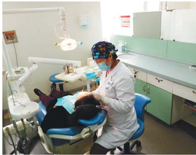
口腔科患者正在就诊。

科大多数医生师从全国著名的专家教授,拥有精湛的医疗技术,综合分析问题的能力,能开展口腔专业所有的常规和特殊诊疗项目,具备多学科综合治疗的协同优势。不仅如此,他们特别注重新技术的应用和新观念的培养,近年来多次派遣科室青年骨干到全省顶级医院进修学习与技术交流。造就了一支技术力量雄厚、结构合理、素质较高的专业团队。