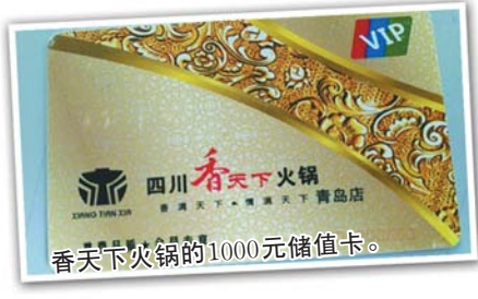
香天下火锅的1000元储值卡。