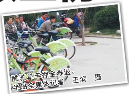
酷骑单车押金难退。