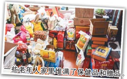
一些老年人家里堆满了保健品和赠品。