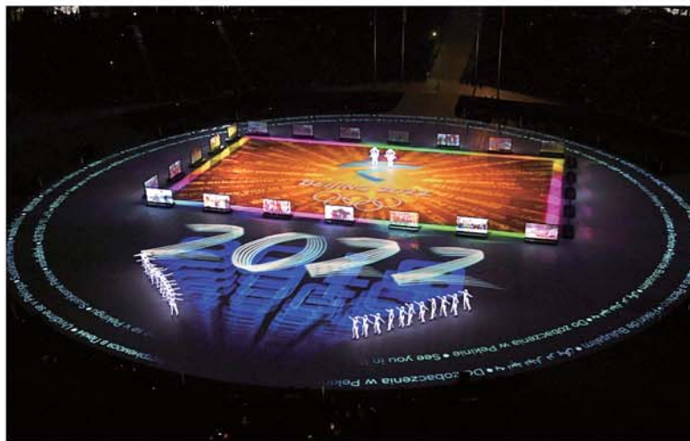
►在展演现场,显现出“2022”字样。