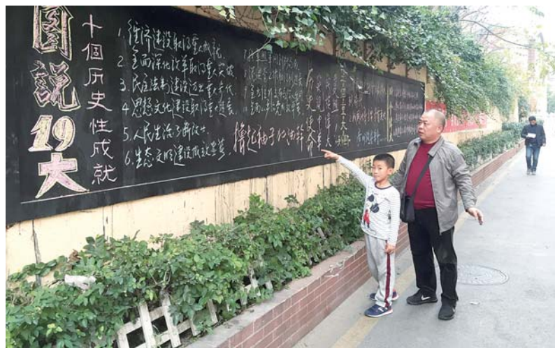
手抄报助力十九大精神宣传。