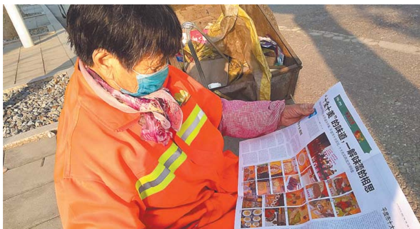
环卫工人被十大名吃吸引。