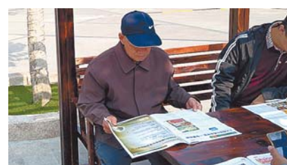
▲在尚街美食部落,一位市民正在看《北纬36°·平度味道》——首届中国美食养生文化节特刊。