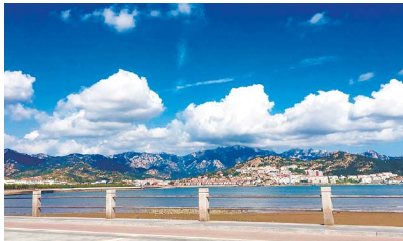
沙子口社区 温妮作品