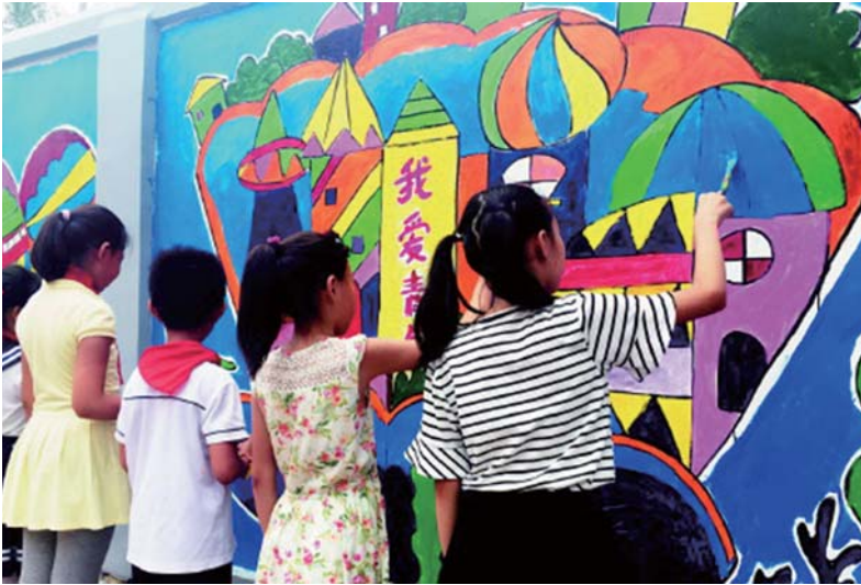
镇江路街道工作人员和北仲路第二小学学生们为墙体进行手绘创作。

缩影。据悉，镇江路街道辖区内的五个社区已经依次轮流进行卫生环境清扫。每周六面向全辖区开展义务劳动，给居民提供舒适的生活环境。“百日大会战”期间，组织多次集体劳动，对辖区五个社区集中开展环境卫生整治，共清理花坛42个7200平方米，修剪树木16株，清理40个平台和120个单元楼道的200余处乱堆乱放，清理卫生死角103处，拆除废旧报箱52个，翻新宣传栏12个，清扫院内地面40000余平方米，铲除墙体和地面粘贴小广告5000余张，彻底清除了居民反映强烈的脏乱差区域8处，清理各类垃圾59吨。