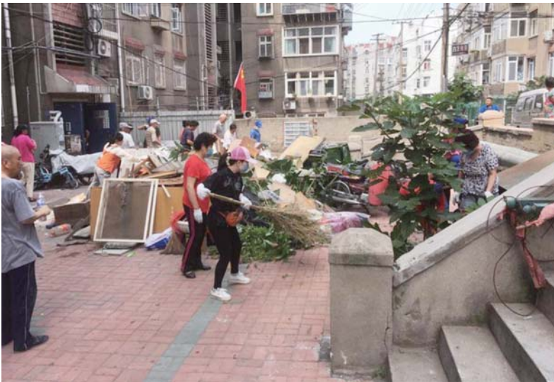
党员干部带头清理楼院卫生。