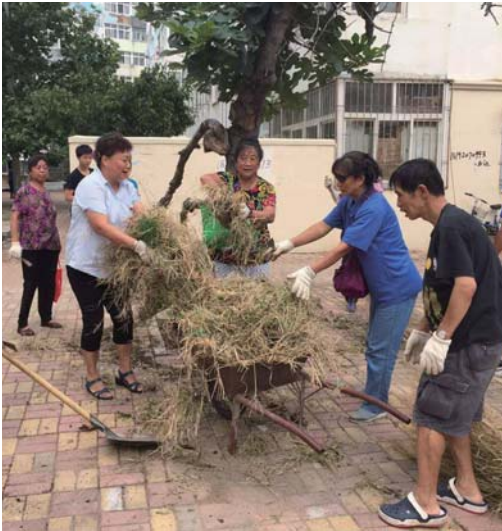
工作人员正在清理楼院杂草。