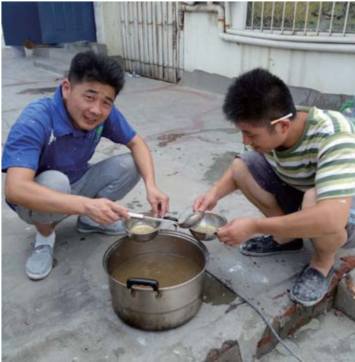
海泊河居民自发做绿豆汤送给工作人员。