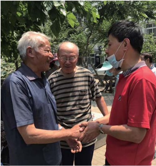
居民看到自家楼院被打扫干净，感谢街道工作人员。