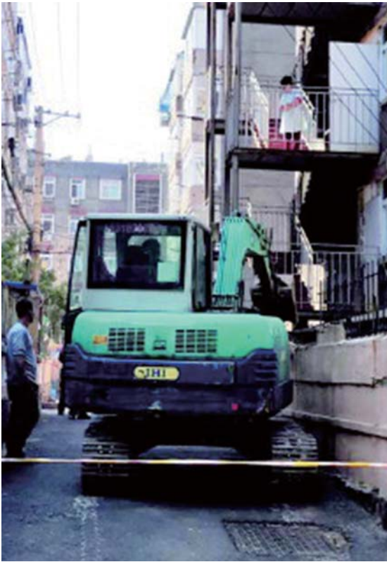
南口路159号颐康敬老院拆除现场。