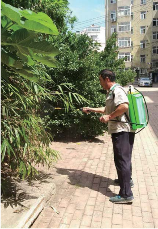
街道为减少蚊虫，给辖区楼院喷洒灭蚊药。