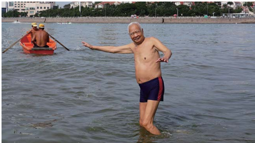
如今，老人每天坚持洗海澡。

除了自然条件的恶劣，美军频繁的空中袭击，也让抢修增加了难度。“那时候，美国飞机飞得特别低，我们都开玩笑说，‘对方飞机低得都能摘下帽子’。我们每个人都在雪地下挖一个自己的防空洞，一有情况，就可以暂时避免遭到空袭。”就在这样恶劣的环境下，尚友贤和战友们一次又一次光荣完成了任务。