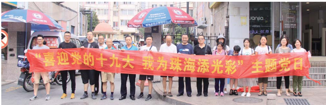
街道机关干部开展主题党日活动，党员们参与卫生大扫除。

文明城市的创建，是所有市民的共同心愿；城市文明的提升，也关乎着每个人的生活；文明城市的坚持，更需要每一位市民的支持和参与。近日，全市全国文明城市复审工作进入重要的攻坚时刻，街道和社区党员、群众纷纷行动起来，从心开始、从小处着眼、从细处入手、突出重点、创新形式，以更加人性化的服务理念扎实开展精神文明建设工作，为加快建设时尚幸福的现代化国际城区做出积极努力！