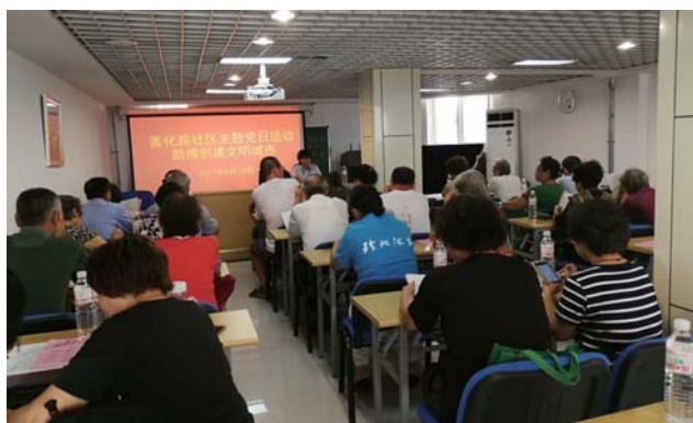
社区召开创城会议。