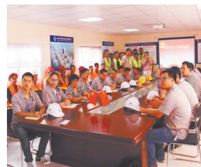
一场生动的法律讲座正在进行。

检、夏季送清凉、安全教育培训、篮球比赛、书画比赛等活动，让党员发挥先锋模范作用，让职工感受到家一样的温暖。党建工作和企业文化打造也成为企业发展的有效抓手。据了解，青岛中建联合建设工程有限公司创建于2005年，是中国建筑装饰行业知名企业和龙头企业——德才装饰股份有限公司的全资子公司，至今业务已涵盖建筑设计、施工、钢结构、装饰装潢、工程代建、设计咨询及国际工程承包与劳务合作等众多领域，是经国家住房与城乡建设部核准的房屋建设工程施工总承包壹级企业。