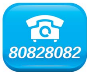
天地和家装发展历程。

俺家有亲戚就是做装修的，俺朋友也是搞装修的，找他们是不是就不用被宰、被坑了？8月30日，记者就岛城装修市场展开调查，靠攀关系、走后门装修出来的花费并没有比整装便宜多少，不光费钱、费精力，甚至还欠下一个大人情。青岛天地和成立以来，就严格按照合同制施工，杜绝增项加价等装修乱象，执行“工厂价零利润装修”，比“亲情价”更加省钱可靠。在入驻青岛一周年店庆之际，天地和特别推出4天5夜邮轮免费双人游、2万元大礼包等诸多店庆礼，免费送全屋家具家电，店庆优惠礼包数量有限，抓紧拨打电话下手抢啦：80828082。