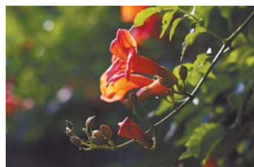
《凌霄花》兴隆路社区 青茶