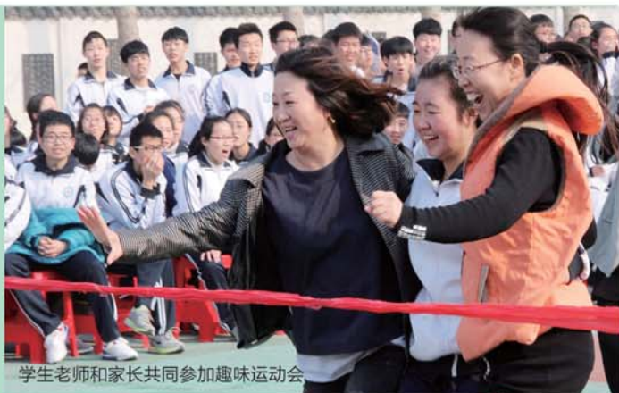
学生老师和家长共同参加趣味运动会。

宝剑锋从磨砺出,梅花香自苦寒来。三年前,228名学生只有1名学生达到公办普通高中录取线,三年后的今天,奋勇拼搏、积极进取的国开一中学子不负众望取得了前所未有的辉煌和飞跃,再次为家长和老师交上了一份满意的答卷!2017年高考,青岛国开第一中学共370人(含复读生142人)参加高考,本科达线人数286人,达线率72.8%。