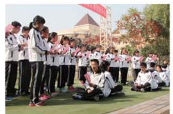
传承经典国学诵读大赛

自建校以来,在各级教育行政部门的正确领导及社会各界人士的关爱下,青岛国开第一中学遵循“国家富强有我在,家庭兴旺有我在,国开发展有我在”的育人理念,紧紧围绕“全心全意为学生服务”这个中心,牢牢抓住“安全和质量”二个工作基本点,突出“精细化、规范化、人文化”的管理思想,采取“因材施教,分类推进”的教育手段,排忧解难,创新奋进,在短短4年多的时间里,取得了骄人的成绩,曾多次荣获“青岛市民办教育先进集体”称号;先后荣获青岛市民最信赖的金牌教育机构、“社会公认、家长放心示范学校”、青岛市“交通安全示范学校”、“中国民办十大知名品牌学校”“中国民办教育改革示范学校”、城阳区社会组织评估等级4A单位、青岛教育总评榜最具活力十佳中小学等多项殊荣;并培养了许多德智体全面发展的优秀学生,赢得了社会各界的普遍认可。