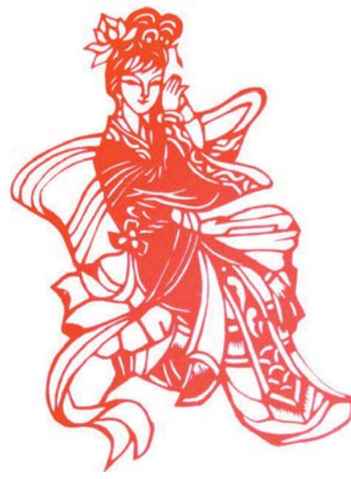
荷花精化成仙胎鱼。