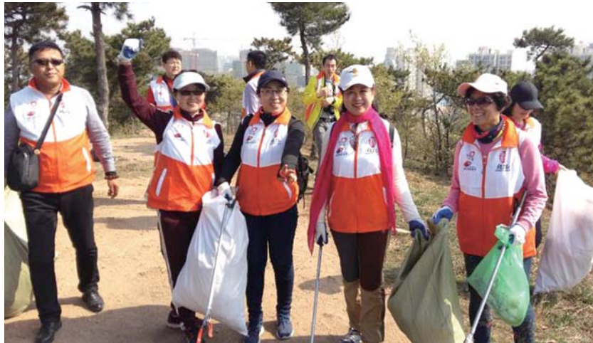
“环保始于足下”第二站,志愿者来到了双山公园。

4月15日上午8时30分,由爱基金、青岛毅跑俱乐部、大四方雨涵暴走团、青岛悟空智联医疗科技公司、海行者协会及爱心市民组成的70多名志愿者团队来到双山公园。大家按计划“兵分两路”有序地向山上进发。“我们经常能看到一