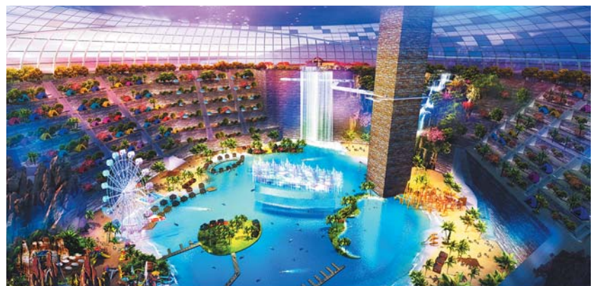
矿坑地质公园室内透视图。

据平度市相关负责人介绍, 该市始终抓牢项目建设这个“牛鼻子”, 坚持领导帮包、全程帮办、重点项目审批绿色通道、决策事项交办单等行之有效的项目推进机制, 为全市经济社会平稳较快发展提供了有力支撑。