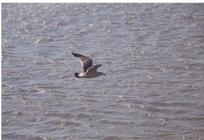
一只“狡猾”的海鸥紧紧盯着回港的渔船,希望能捡个漏网之鱼。