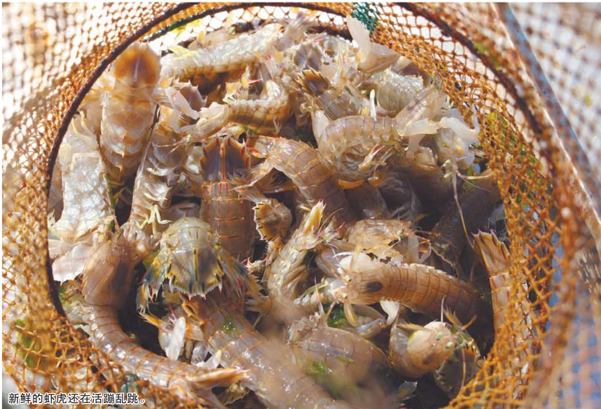
新鲜的虾虎还在活蹦乱跳。