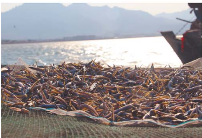
当前也是面条鱼收获季,渔民将一部分进行晾晒出售。