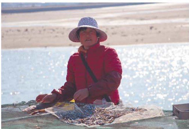
在海边晒鱼的一位渔民。