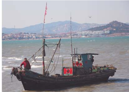
3月31日下午,渔船陆续回到港东码头。