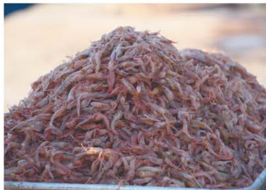
这种小红虾,被用来制作成虾酱,在码头上现场加工。

3月31日下午3时许,港东码头上的渔船陆续靠岸,带回了时下最受欢迎的新鲜海产品。当天海上风大,渔民的收获并不算多,上岸的海货中,有虾虎、面条鱼、八带、小红虾等。船刚一靠岸,就有一大批早已等待在码头的市民围拢上去,询价抢购。渔民老刘告诉半岛记者,当前的虾虎新鲜肥美,价格在40~50元一斤。据悉,今年的休渔期增加了一个月,从5月1日12时开始,一直到9月1日12时结束。趁着休渔期来临前,抓紧时间尝鲜吧!