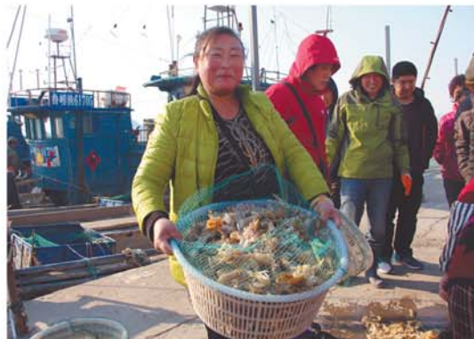
虾虎个头够大够肥,一上岸就被市民抢光。