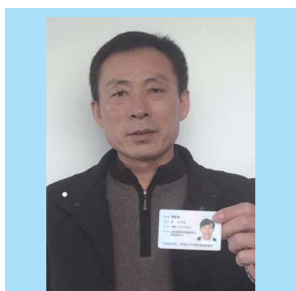
渔民老薛:敢于亮明身份就是要督促自己,拒绝添加,拒绝问题参!凭良心做事,只做好海参!