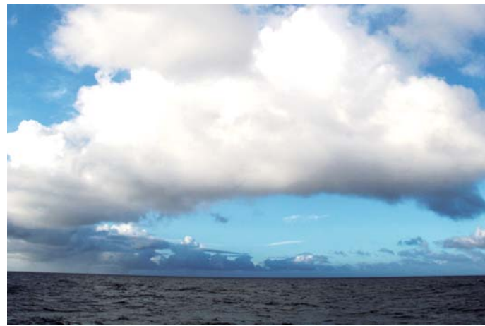
棉花糖一般的云朵。