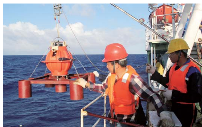
科考队员在玛丽亚纳海沟附近投放地震仪。