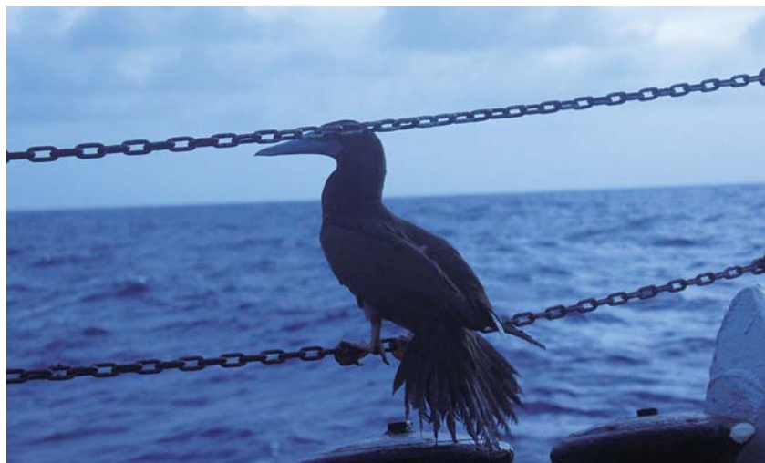
跟着科考船飞了两天的海鸟,对人毫无戒备心。