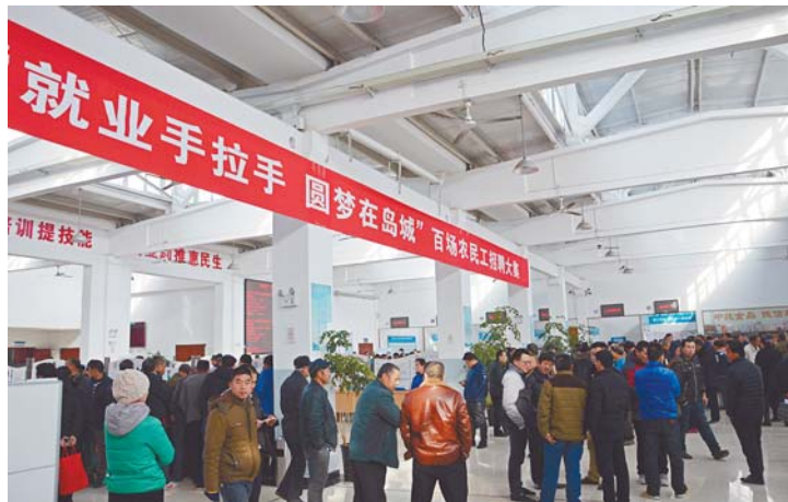
招聘会现场人头攒动。

据人社中心统计,当天辖区企业共达成用工协议50余对,双方有继续了解意向的130余对,招聘会取得良好效果。此外,在街道专区,人社中心的工作人员还设置了便民服务点,为居民解读劳动维权、创业就业、职业技能培训、保险等相关政策,发放相关宣传手册400余份。