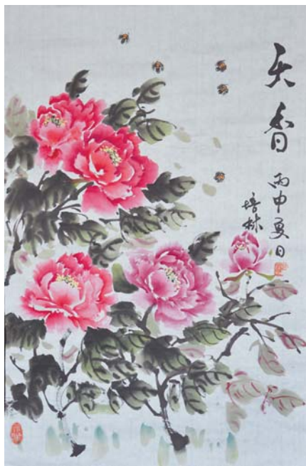
水墨画——牡丹 辽阳西路社区 郭培林