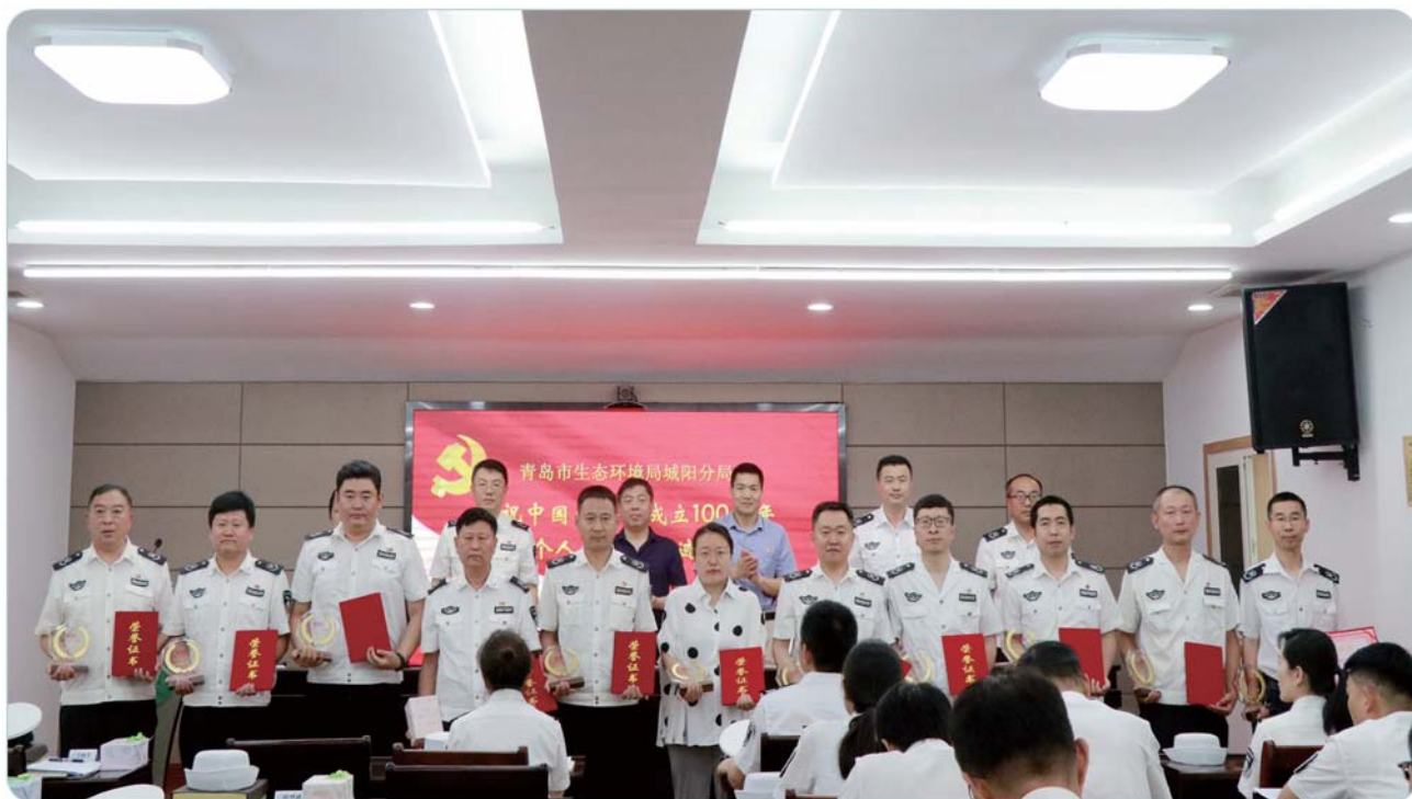
建党节前夕，举行党员表彰活动。

传承红色基因，赓续精神血脉。党史学习教育开展过程中，城阳生态环境分局努力把学习教育成果转化为增强党