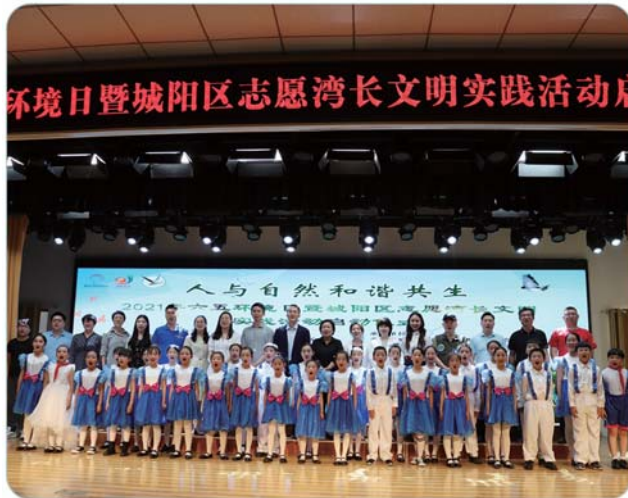
开展文明实践活动，吸引公众参与。