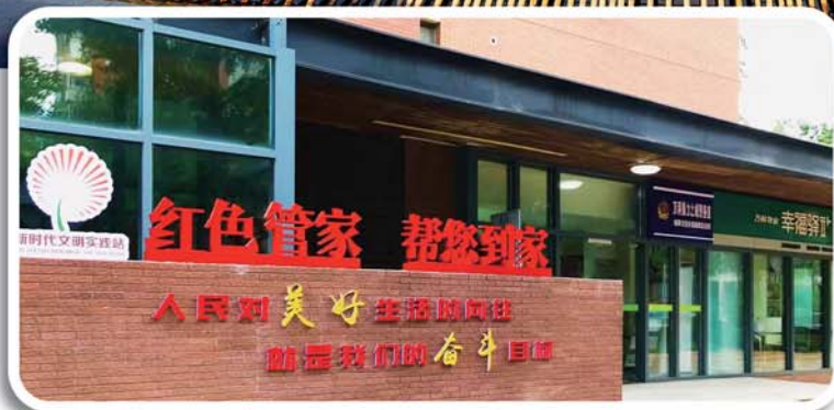
打造红色物业，打通基层治理微循环。