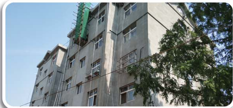
积极实施城区老旧小区改造，努力让居民“住有宜居”。