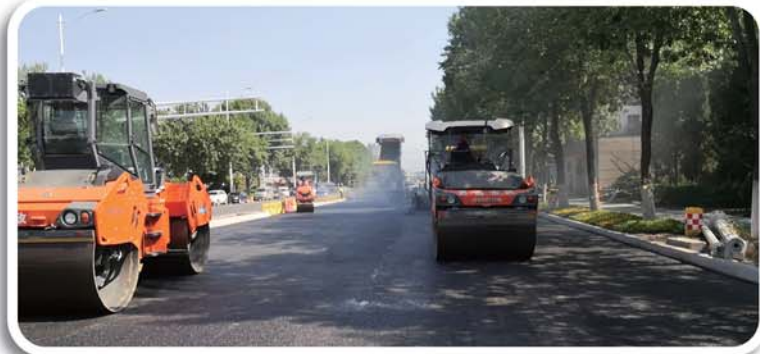
加强交通基础设施建设，推动道路提升改造。