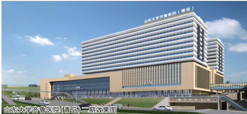
山东大学齐鲁医院(青岛)二期效果图

医院坚持党建引领医院文化与制度建设,用百年齐鲁优秀文化凝聚思想共识,为医院发展凝心聚力。建立了以“医道从德、术业求精”院训精神为本的文化理念系统,让行为形成习惯,让习惯展现形象。