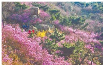
《万紫千红》 百通花园社区 任炳和