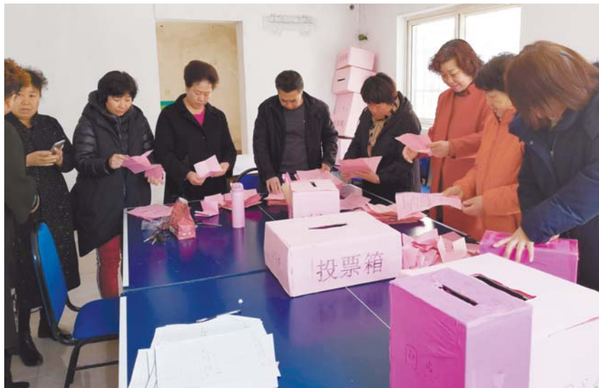
城东小区选举业委会公开透明。

小区物业服务品质的好坏，直接决定了业主居住的幸福。旭东社区城东小区因老物业突然退出，小区管理出现空挡，业主人心惶惶。这时，旭东社区两委班子主动担当作为，将该小区物业选聘列入今年“攻山头、炸碉堡、打硬仗”行动目标，付出大量的心血，调动党员、楼长积极带头作用，最终攻下这一“山头”，避免了物业空挡期小区混乱的局面，让老百姓的生活环境更加舒心。4月23日，记者来到旭东社区，采访了“打硬仗”的艰辛历程。