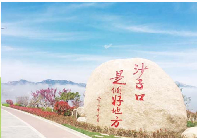
沙子口居民段女士摄影作品