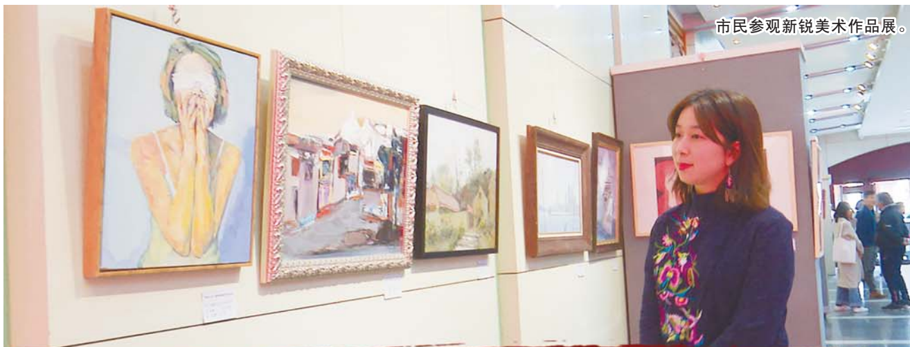
市民参观新锐美术作品展。