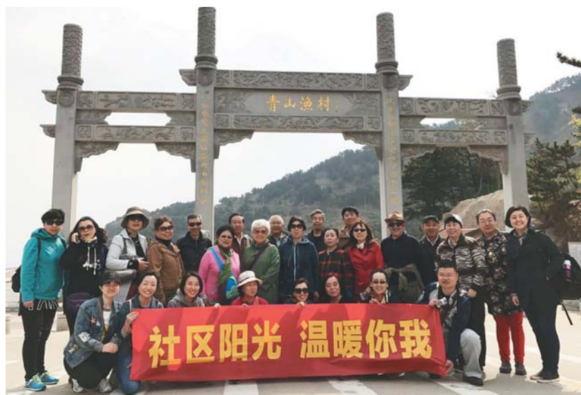
参加活动人员留念。