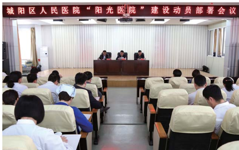
城阳人民医院“阳光医院”建设动员部署会。

据了解，城阳人民医院推行阳光优质服务。以“阳光服务”为主题，以“患者满意是我们服务的标准”为口号，遵循“治疗综合化、护理整体化、服务热情化”的理念，严格落实医德规范、服务规范，