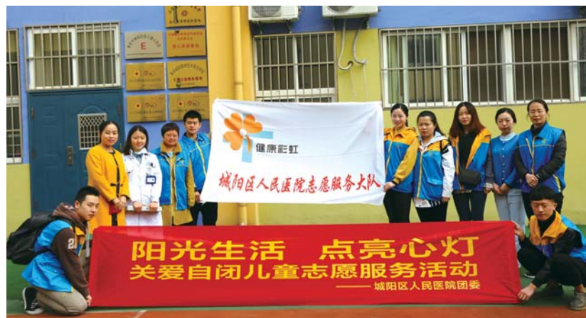
阳光生活志愿者开展关爱自闭症儿童志愿服务活动。

真诚为患者服务，打造安全、舒适的“阳光病房”和优质、高效、周到的“阳光服务”。畅通投诉受理渠道，坚持“群众来电无小事”，打造一流的“阳光客服”工作平台。扎实做好诊前预约、诊后随访，有序衔接各个诊疗环节，让“阳光服务”一路相伴。