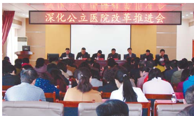
▲深化公立医院改革推进会。