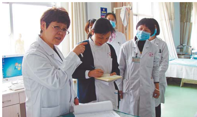
▲督查组专家现场查看针推康复科。