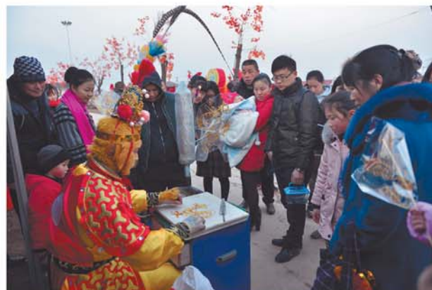
会场上的糖画制作,吸引人们驻足观赏。