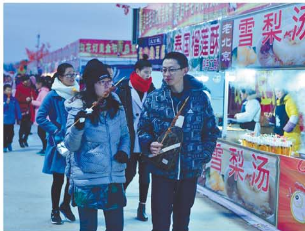
赏花灯,吃美食,心情美。