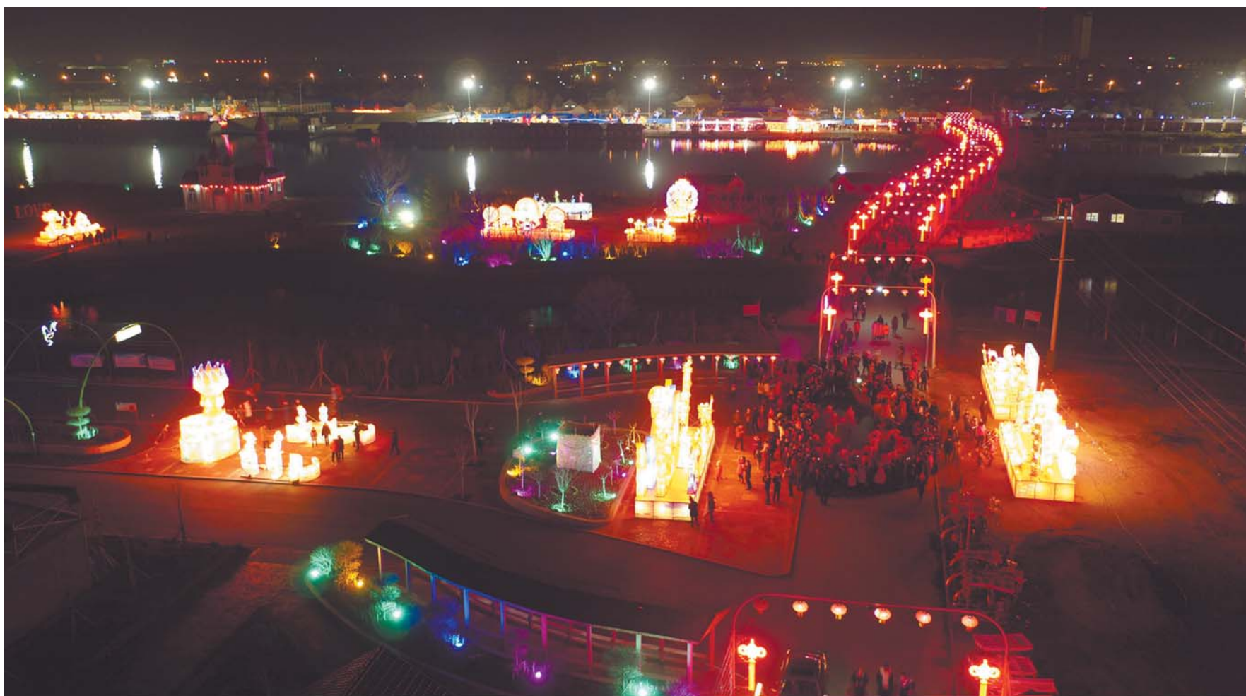
夜空下的灯会上灯火通明,好不热闹。