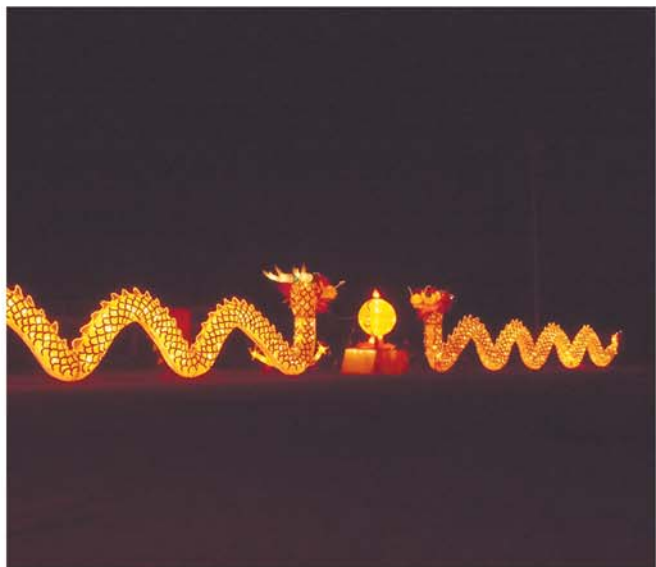
灯会上最长的灯组“二龙戏珠”长达60米,是本届灯会的“灯王”。